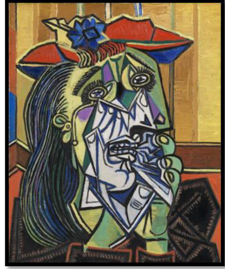
Tablo 8: Pablo Picasso, Ağlayan Kadın