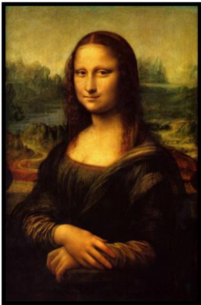
Tablo 12: Leonardo Da Vinci, Mona Lisa

Bu eser, Çallı' nın bir araştırma, deneme yaptığı bir eserdir ve özgün başyapıtları arasına girmez. Bu bağlamda Çallı' nın eserlerini en üstte değer gören tablosu, en altta değer gören ve orta değerdekiler olarak beşe ayırırsak bu eser, en altta değer gören tabloları arasına girer.