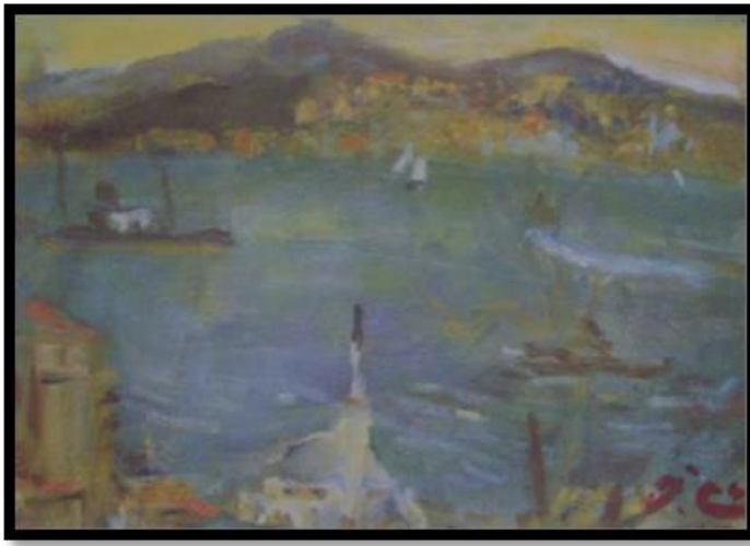
Tablo 4: İbrahim Çallı, Yıldız Parkı'ndan Boğaziçi