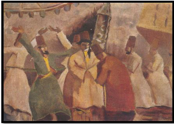
Tablo 6: İbrahim Çallı, Mevleviler

Sanatı için bir kırılma noktası sayılır. 1914 Kuşağı döneminde bir yenilik olan bu konu, başarılı bir şekilde Çallı Kuşağı ressamı tarafından işlenmiştir. 1914 yılında ülkeye dönen bu ressamlarımız Kurtuluş Savaşı'nın başladığı bu yıllarda savaş konulu eserler üretecekleri Şişli Atölyesi'nde çalıştılar. Çallı Kuşağı olarak adlandırılan bu ressamlar empresyonizmin ışığında eserler ürettiler.