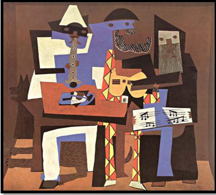
Tablo 7: Pablo Picasso, Üç Müzisyen