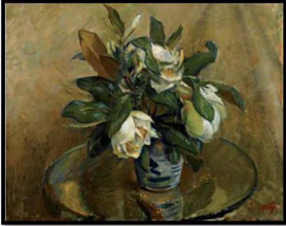
Tablo 5: İbrahim Çallı, Manolyalar

Sanatı için bir kırılma noktası sayılır. 1914 Kuşağı döneminde bir yenilik olan bu konu, başarılı bir şekilde Çallı Kuşağı ressamı tarafından işlenmiştir. 1914 yılında ülkeye dönen bu ressamlarımız Kurtuluş Savaşı'nın başladığı bu yıllarda savaş konulu eserler üretecekleri Şişli Atölyesi'nde çalıştılar. Çallı Kuşağı olarak adlandırılan bu ressamlar empresyonizmin ışığında eserler ürettiler.