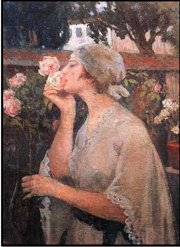
Tablo 1: İbrahim Çallı, Gül Koklayan Kadın

İş Bankası Koleksiyonu' nda yer alan "Gül Koklayan Kadın" adlı eser, 50x72 cm. ebatlarında olup, tuval üzerine yağlıboya tekniğinde yapılmıştır.