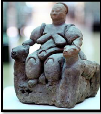
Tablo 11: Kibele heykeli